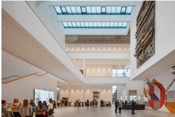
Bild 1: Die Weite der Räume der Kunsthalle Mannheim und besonders das 22 Meter hohe, von Tageslicht durchflutete Atrium stellen besondere Ansprüche an die Beleuchtung.