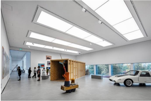
Bild 4: Dank Zumtobel ist die Kunsthalle Mannheim für alle künftigen Sonderausstellungen optimal ausgestattet, wie beispielsweise die erste große Thementausstellung, die am 11. Oktober 2018 eröffnet wurde: „Konstruktion der Welt: Kunst und Ökonomie“.